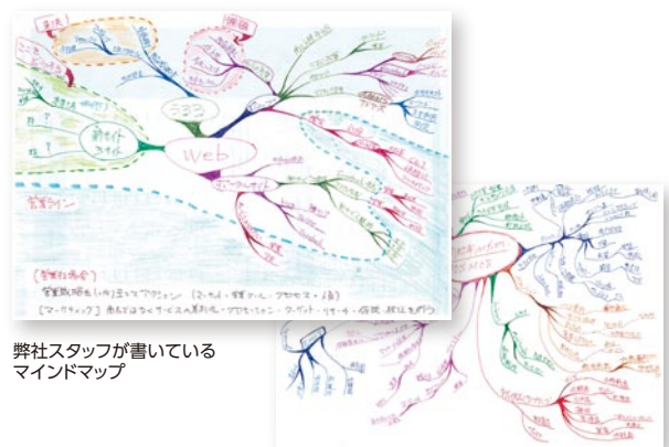
弊社スタッフが書いているマインドマップ

かつては限られた職種の現場でのみ使われていましたが、発想力が求められる今の時代、身につけておいて損はありません。今回はその書き方を簡単にご紹介します。