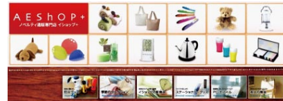
イショップ (AESHOP) 公式facebookページ http://www.facebook.com/AEShop.net

タイムライン導入のため、当社の公式facebookページのデザインも変わりました。 ぜひ、一度 アクセスしてみてくださいね!