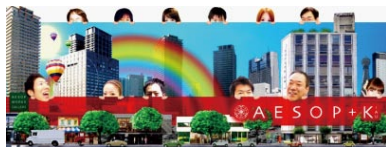
株式会社イソップ企画 公式facebookページ http://www.facebook.com/aesopkikaku